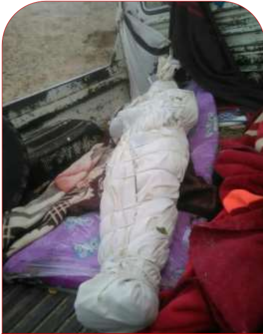
جثة أحد ضحايا القصف

في الصباح الباكر من يوم الاثنين خرج سبعة مدنيين بينهم طفل على سيارة متسوقين لجلب بعض الأغنام وبعد اذان الفجر توقفوا عند حوض ماء في المزحاط على الطريق لأداء صلاة الفجر وفي تلك الأثناء حلق الطيران الحربي لدول التحالف السعودي واستهدفهم بغارة جوية قتل منهم (٢) وأصيب (٤) آخرين بينهم طفل وإتلاف سيارتهم ونفوق عدد من الأغنام التي كانوا قد جلبوها لتسويقها.