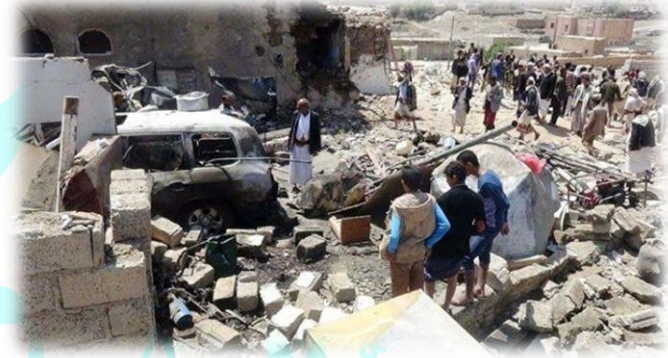
صورة للدمار والخراب والحريق في المنزل والسيارات