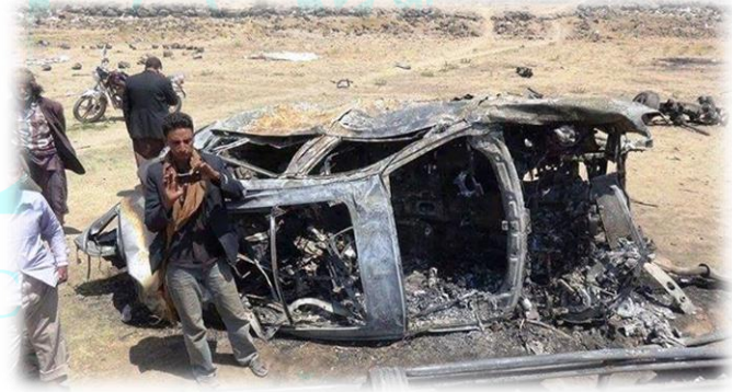
إحدى السيارات التي أوصلت العرائس احترقت بالكامل