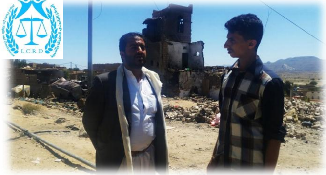
الصورة الخلفية توضح حجم الدمار في منزل العرس