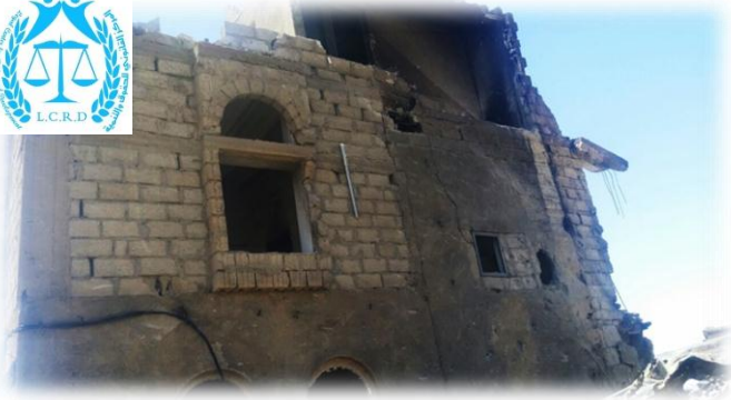
صورة جانبية تظهر الدمار في منزل العرس