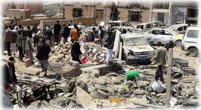
صورتين تظهر الدمار والخراب للمنزل والسيارات التي كانت في موكب العرائس