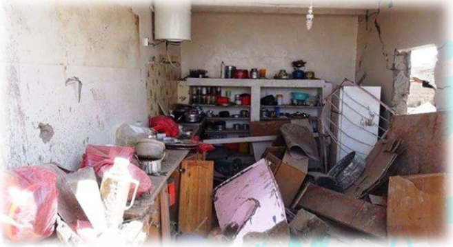
صورة لمطبخ منزل العرس