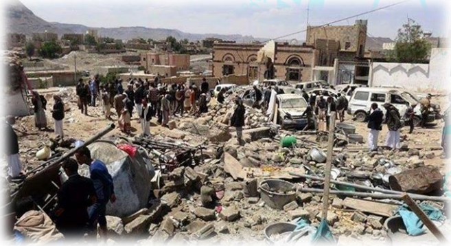
بقايا ركام منزل العرس