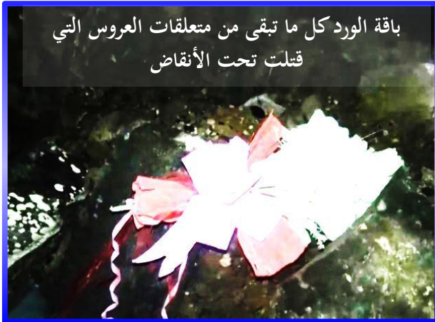
باقة الورد كل ما تبقى من متعلقات العروس التي قتلت تحت الأنقاض