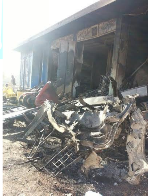
محلات تجارية ومساكن مدنية تهدمت فوق ساكنيها بسبب استهدافها من قبل طائرات السعودية وتحالفها