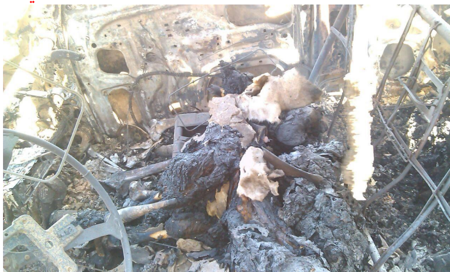
صورة لجثث متفحمة من جراء قصف الطيران السعودي وتحالفه في مدينة حوث