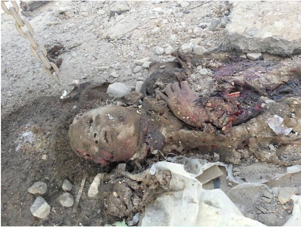
طفل تتأثر أشلائه من ضحايا قصف الطيران السعودي وتحالفه على مدينة حوث