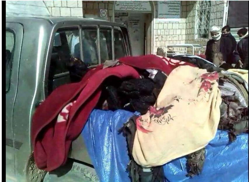
سيارة نقل تحمل جثث متفحمة لضحايا قصف الطائرات الحربية للسعودية وتحالفها على مدينة حوث