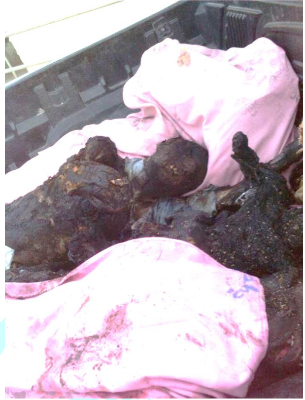
جث متفحمة جراء قصف طيران السعودية وتحالفها على مدينة حوث