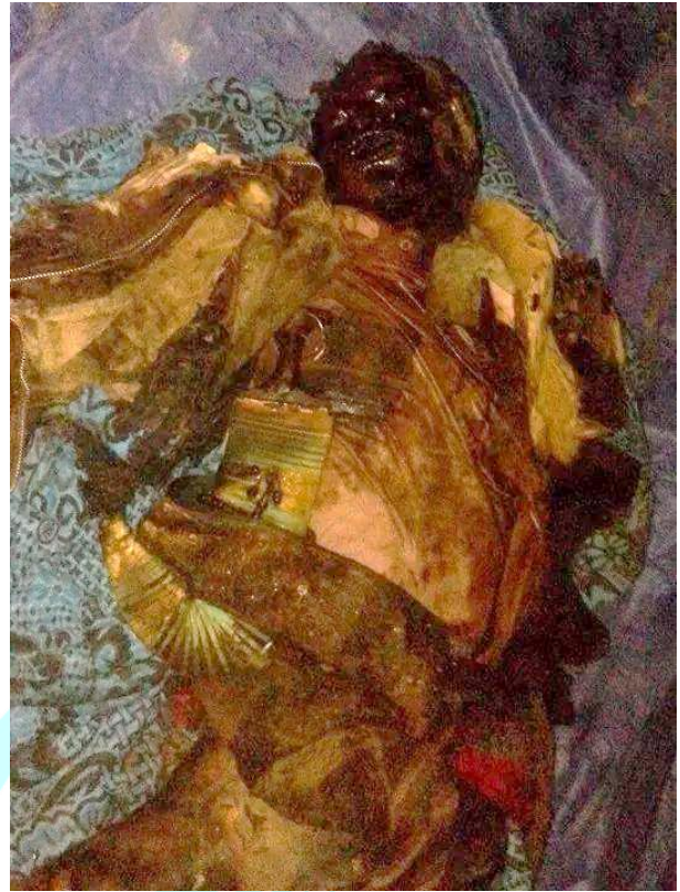
جثث محتزنة لكبار السن من ضحايا القصف السعودي وحلفائه على مدينة حوث