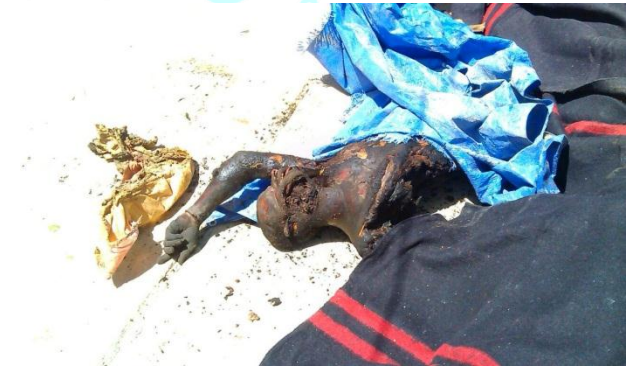
بعض الجثث المتفحمة جراء القصف