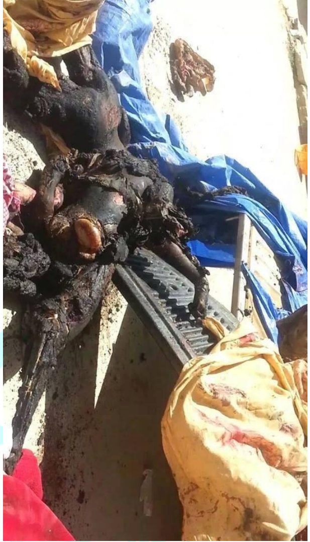
جثث بعض ضحايا تفحمت جراء القصف على سوق تجاري في مدينة حوث