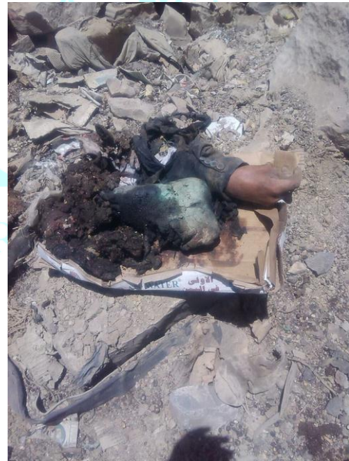
أشلاء وجث من ضحايا قصف الطيران السعودي وحلفائه على مدينة حوث