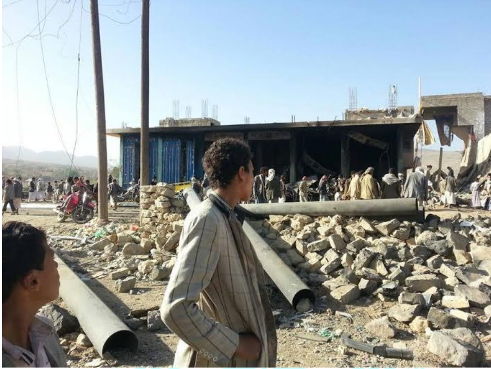
محلات تجارية دُمرت بالكامل