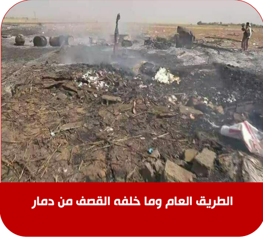
الطريق العام وما خلفه القصف من دمار