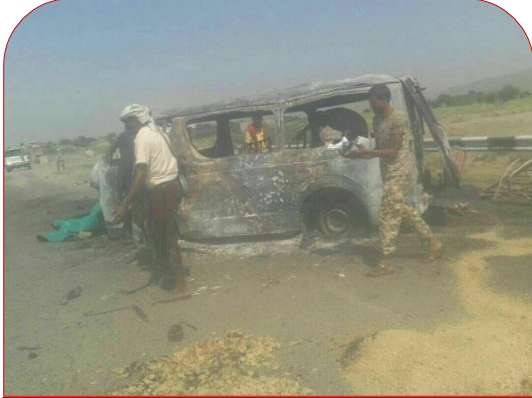
حافلة نقل المسافرين وأثار الحريق الذي أصابها

ازدادت في الآونة الأخيرة وتيرة استهداف الطائرات الحربية التابعة للتحالف السعودي للمدنيين في اليمن سواء كانوا في منازلهم أو في الأسواق أو حتى في الطرقات العامة ، ومن هذه الوقائع ما حدث في يوم الجمعة الموافق ٢٠١٧/١١/١٧م ، حيث قامت الطائرات الحربية التابعة للتحالف بشن غارتين جوية على الطريق العام في منطقة الخميس الواقعة في مديرية الزهرة والتابعة لمحافظة الحديدة ، مستهدفة في الغارة الأولى حافلة تقل مسافرين ما أدى إلى قتلهم جميعاً وحرقتهم حتى تفحمت اجسادهم ، قام بعدها سكان المنطقة