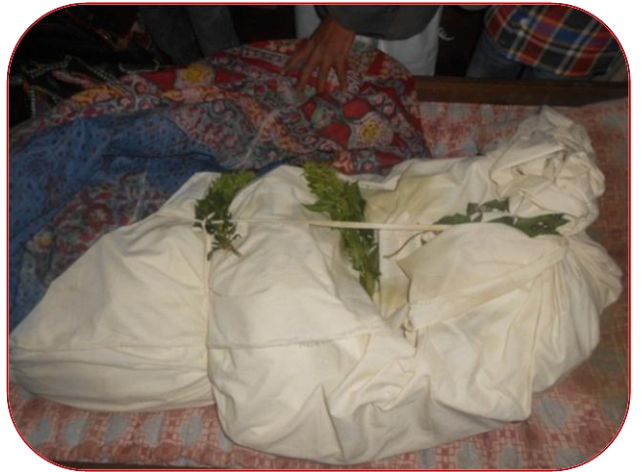
جثة الزوجة/ حورية سعد الحديد وبجوارها بعض جثث أولادها الذين ماتوا معها تحت أنقاض منزلهم