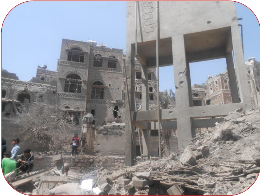
الأضرار في مضختين لمياه الشرب مع الخزان التابع لهما وجانب من الأضرار في المنازل المجاورة

صدر عن المركز القانوني للحقوق والتنمية – بتاريخ ٢٠ سبتمبر ٢٠١٥م