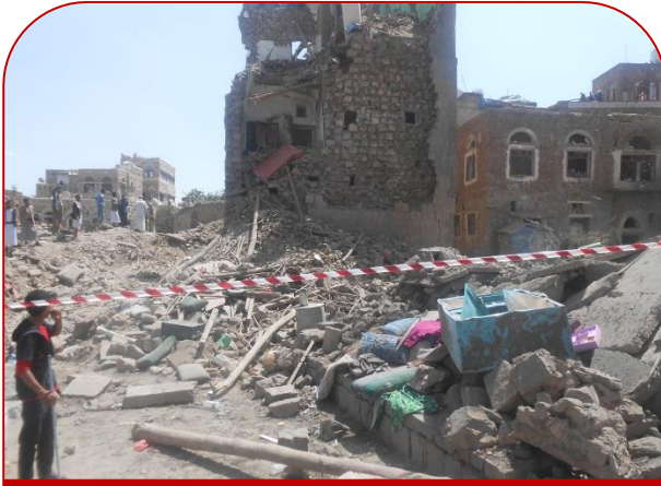
الحي والمنازل المستهدفة في صنعاء القديمة

المركز القانوني من خلال توثيقه الميداني للواقعة واستماعه لروايات الناجين من الضحايا وشهود العيان من أهالي حي الفليحي وجدنا أن الواقعة تتلخص في أن طائرات التحالف السعودي كثفت من تحليقها في سماء صنعاء وقصفت عدد من المناطق خارج أسوار صنعاء القديمة ، خلفت العشرات من الضحايا ، وقبل أن تشير الساعة إلى منتصف الليل عادت طائرات الموت للتخليق مجدداً لتذكر سكان أمانة العاصمة بأن بلادهم ، أرواحهم ، منازلهم ، وأماكن رزقهم أصبحت هدفاً لأولئك الخارجون عن قيم الإنسانية ، لم يكن أهل المدينة التاريخية يعلمون أنهم على موعد مع الموت ، وأن منازلهم