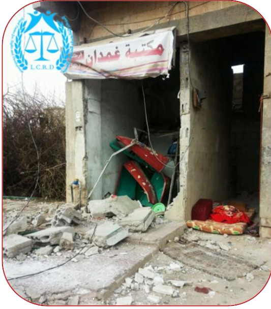
صورة توضح الدمار الذي لحق بمكتبة مدرسة غمدان