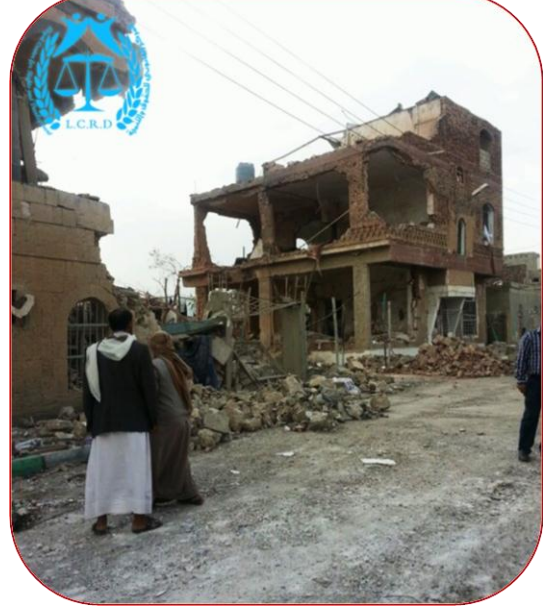
صورة توضح تدمير القصف لبيت الناشري والمنازل المجاورة له