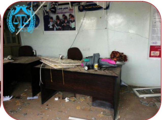
صور توضح الدمار والاضرار التي لحقت بمدرسة غمدان

صدر عن / المركز القانوني للحقوق والتنمية، بتاريخ ٤ يوليو ٢٠١٥م