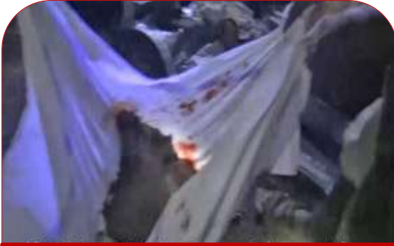
بعض الأشلء التي تم تجميعها لضحايا القصف

بئر لمياه الشرب يدوية يعمل فيها ٩ مدنيين من أبناء المنطقة عليهم ليجدون ما يسد حاجاتهم وأهليهم من المياه النقية لكن طيران تحالف العدوان السعودي قد رصدتهم واعتبر مشروع المياه الذين يعملون في استخراجها أحد أبرز أهدافه والتي يسعى جاهداً إلى حصد أكبر عدد ممكن من البئر لتجويعهم وقصف كل مصادر المياه التي تروي عطشهم وتسد رمقهم بغية فرض أجندة وإرهاب كل مواطن يمني مرتكب في سبيل ذلك أبشع الجرائم ضد الإنسانية والتي ترقى إلى