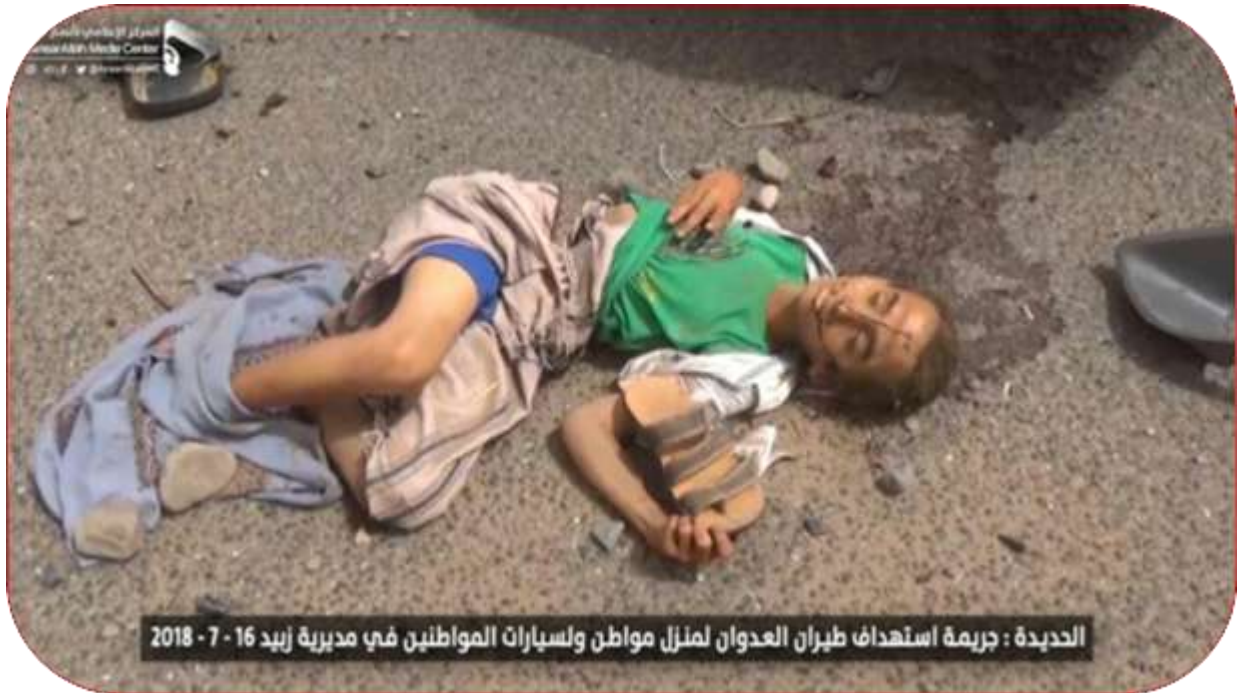
الحديدة : جريمة استهداف طيران العدوان لمنزل مواطن ولسيارات المواطنين في مديرية زبيد 16 - 7 - 2018