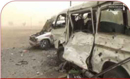
آثار الدمار على المركبات المستهدفة

عند الساعة الواحدة بعد ظهر يوم الاثنين الموافق ١٦ يوليو ٢٠١٨م أقدم طيران التحالف السعودي