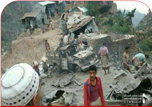
جانب من الدمار الذي لحق بالسوق