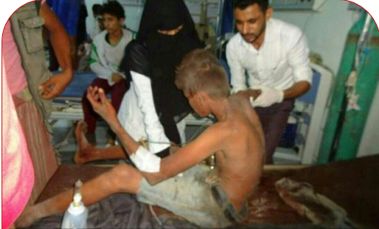
أحد الأطفال من الضحايا الجرحى