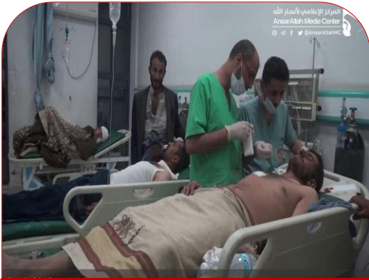
أحد الضحايا أثناء تلقيه العلاج بالمستشفى

عند الساعة الـ ٨:٠٠ من مساء يوم الأحد الموافق ٧ أكتوبر ٢٠١٨م شنت طائفة حربية للتحالف السعودي غارة جوية استهدفت محجراً طبيعياً لأحجار البناء أثناء تواجد ٧ عمال مدنيين يقومون برفع أحجار البناء ووضعها على شاحنة نقل الأحجار، يقع المحجر بمنطقة جيرف - مديرية سحنان - محافظة صنعاء، أسفرت الغارة عن مقتل (٣) عمال وجرح (٤) آخرين وتدمير شبه كلي لشاحنة نقل الأحجار تابعة لأحد العمال الضحايا، أسماء وبيانات العمال قتلى وجرحى أوردناها في ملاحق هذا التقرير.