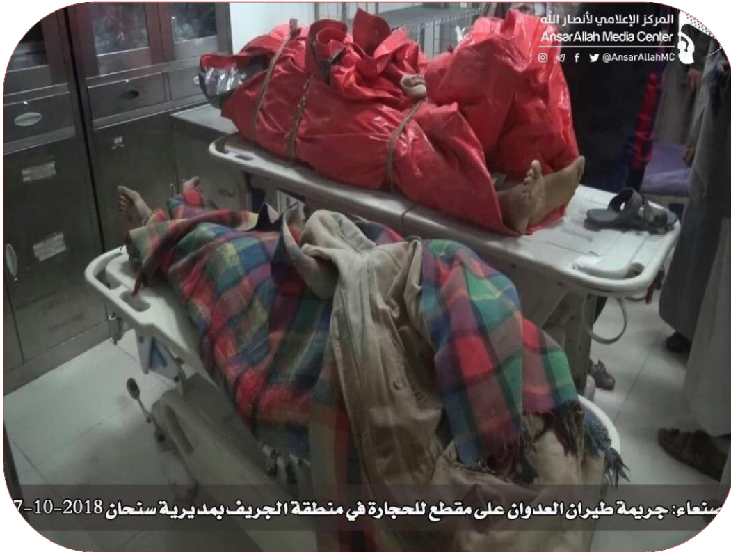
صنعاء: جريمة طيران العدوان على مقطع للحجارة في منطقة الجريف بمديرية سنحان 7-10-2018