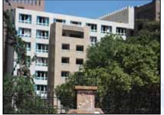
صورة بعض الأضرار التي تأثر بها فندق موفمبيك جراء قصف الطيران السعودي وتحالفه على جبل نغم