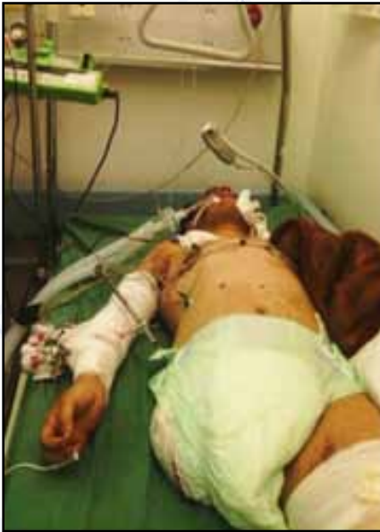
صورة لرجل في مستشفى الثورة العام - بترت رجله بسبب الجراح التي أصيب بها من قصف السعودية وتحالفها لسفح جبل نغم - مديرية آزال أمانة العاصمة