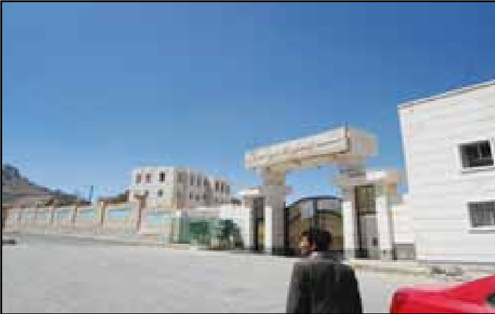
صورة توضح تأثر مبنى المعهد التركي بأضرار جراء قصف الطيران الحربي للسعودية وتحالفها على جبل نغم