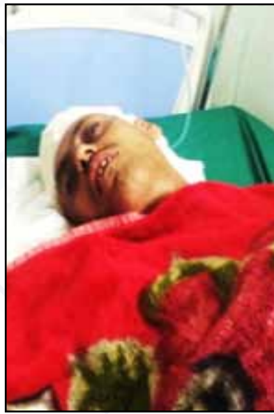
صورة ل أحد الضحايا من المدنيين في مستشفى الثورة العام أصبته طائرات السعودية وتحالفها أثناء قصفها حي نغم - أمانة العاصمة بتاريخ ١١ / ٥ / ٢٠١٥