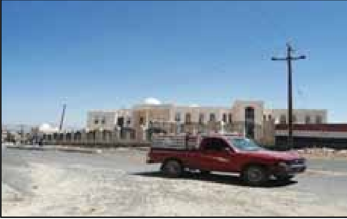
صورة الأضرار في مبنى المحكمة التجارية بأمانة العاصمة بسبب قصف الطيران الحربي للسعودية وتحالفها على جبل نغم

الآلاف من المنازل تضررت ، وبينها منازل تدمرت كلياً ، كما أن المركز القانوني قام بتوثيق المدارس والمساجد والأسواق والمحلات التجارية ، والفنادق ومحطات البترول ومنشآت حكومية وقضائية وتربوية وتعليمية والسفارات التي لحقها ضرر كبير جراء ذلك القصف ومنها سفارة بريطانيا والسفارة الأمريكية والقطرية .