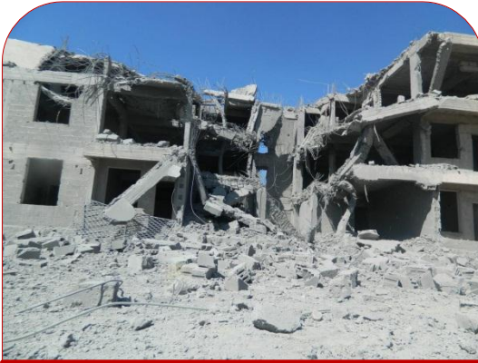
الدمار الذي لحق بالمبنى المستهدف

تستمر الطائرات الحربية التابعة للتحالف العربي بقيادة السعودية في تدمير البنية التحتية لليمن واستهداف المدنيين الأبرياء والمنشآت المدنية بالغارات الجوية ، ففي يوم الأحد في حوالي الساعة الواحدة الموافق ٥ نوفمبر ٢٠١٧م قامت الطائرات الحربية التابعة للتحالف السعودي بشن ثلاث غارات جوية على مبنى بجانب الطريق العام في منطقة الخميس التابعة لمديرية بني الحارث بأمانة العاصمة أثناء مرور المدنيين والسيارات المدنية فيه ، وقد نتج عن هذه