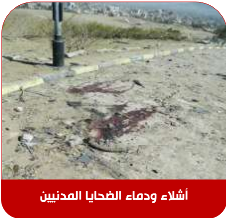
أشلاء ودماء الضحايا المدنيين

"كنا آمنين مطمئنين في منزلنا الكائن بمنتزه النصب التذكاري المصري بمنطقة عصر وفجأة وقعت أول