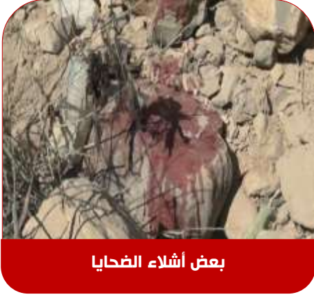
بعض أشلاء الضحايا