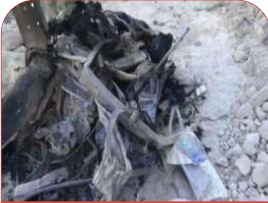
السيارة التي تم استهدافها

في حوالي الساعة الحادية عشر والنصف ليل يوم السبت الموافق ١٦/١٢/٢٠١٧م أقدمت طائرات التحالف السعودي الحربية على شن ثلاث غارات جوية على منطقة بني هيسان التابعة لمديرية حريب القراميش - محافظة مأرب بعد تحليق مكثف للطيران دام لمدة ساعة ونصف بحسب الشهود ، الغارات استهدفت مجموعة من النساء في الطريق العام أثناء عودتهن من حضور حفل زفاف.