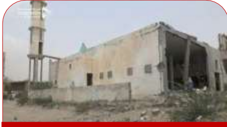
جانب من الدمار الذي لحق بمسجد الخير

"خلال ما كنت في طريق عودتي الى منزلنا الكائن بحي ربع العلي بمدينة زبيد سمعت صوت تحليق الطيران الحربي لتحالف العدوان السعودي في أجواء المدينة ، وفجأة عند الساعة الـ ٥:٣٠ قبل الغروب سمعت صوت صفير الغارة الجوية الأولى ، فشاهدتها عندما استهدفت مدرسة عبدالله عطية فقلقت