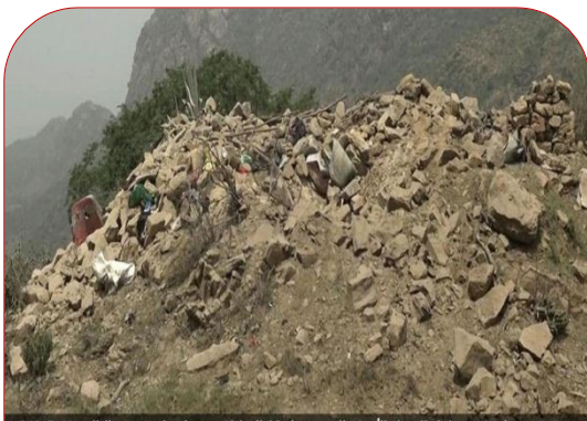
جانب من المكان المستهدف

عند الساعة الـ٧ من صباح يوم السبت الموافق ٢٣ يونيو ٢٠١٨م شنت طائرتين حربيّتين أو أكثر