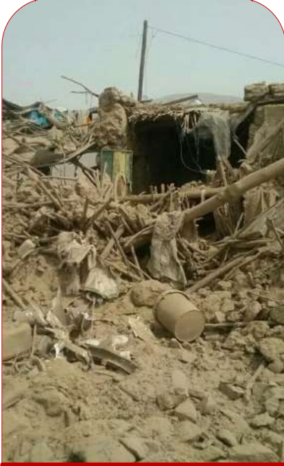
جانب من الدمار الذي لحق بالمنزل