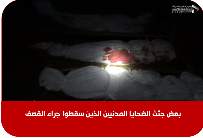
بعض جثث الضحايا المدنيين الذين سقطوا جراء القصف

أطلقت قوات التحالف السعودي البرية قذيفة مدفعية عشوائية عند الساعة الـ٤:٠٠ من مساء يوم