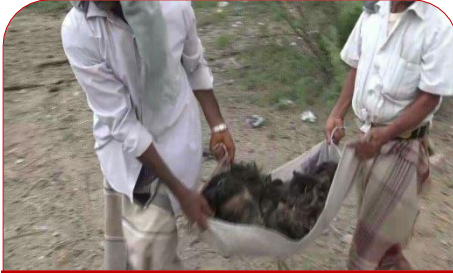
تجميع لبعض أشلاء الضحايا

شديدة الانفجار أحاله أجساد الأطفال والنساء إلى أشلاء متناثرة في المنطقة جميع الأشلاء متناثرة في المنطقة جميع الأشلاء تفحمت نتيجة للغارة نظراً لتواضع منزلهم والذي هو عبارة عن طوب وأخشاب وعش لم ينج من الأسرة سوى الأب وطفلين كانوا خارج المنزل ، أبناؤه وزوجتيه قتلوا جميعهم ، كان من ضمنهم إحدى بناته المتزوجة لابن أخيه مع ابنتها ، وزوجته الأخرى قتلت أيضاً وهي حامل في نهاية الشهر السابع وقتل الجنين وتناثرت أشلائه في المنطقة.