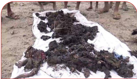
تجميع أشلاء الضحايا من فناء المزرعة