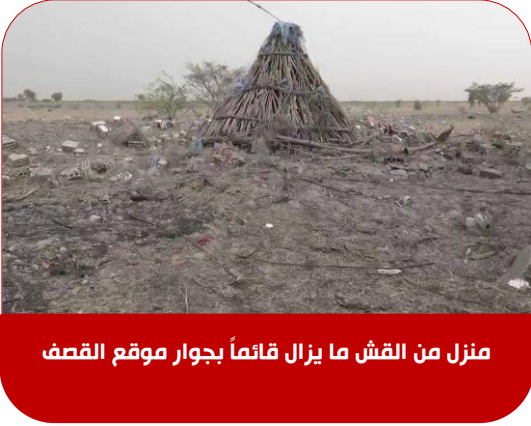
منزل من القش ما يزال قائماً بجوار موقع القصف

تقع قرية نوبة عامر شمار شرق يختل وتبعد عنها عشرة كيلومتر تقريباً وهي أحد القرى بعزلة الزاهر بمديرية المخاء محافظة تعز ويسكنها مدنيين أبرياء يعيشون في منازل معظمها من القش.